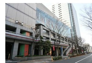
すみだトリフォニーホール

※この図面はATBBの物件情報の一部を抜粋して掲載しております。(現況優先) ※入居日・引渡日変更や付帯条件、別途料金が発生する場合がありますのでご確認ください。